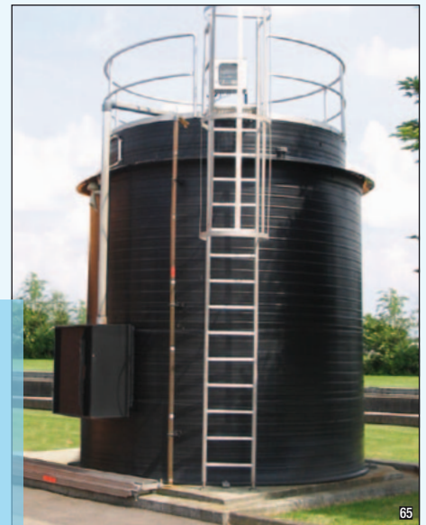
Serbatoio con vasca di sicurezza e scossalina anti-pioggia per stoccaggio coagulante per impianto trattamento acque (capacità 25.000 litri, Ø 3.000 mm, h 4700 mm)