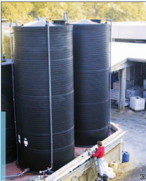
Serbatoi in bacino di cemento per stoccaggio acido fosforico 75% (capacità cad 50.000 litri, Ø 3.000 mm, h 7500 mm)