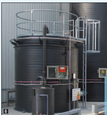
Serbatoio a doppia parete con VSC (sistema di controllo perdite sottovuoto): massima sicurezza senza vasca di sicurezza.

I serbatoi Formoplast realizzati in estrusione rotativa secondo la Normativa Europea EN 12573, possono essere verticali od orizzontali. Hanno corpo cilindrico con diametro da 800 a 4000 mm, spessore da 10 a 150 mm, altezza da 1 metro a circa 24 metri, capacità da 1000 a 200.000 litri e soddisfano i requisiti sulle leggi di sicurezza e antinquinamento del territorio.