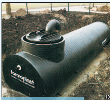
Serbatoio orizzontale da interro