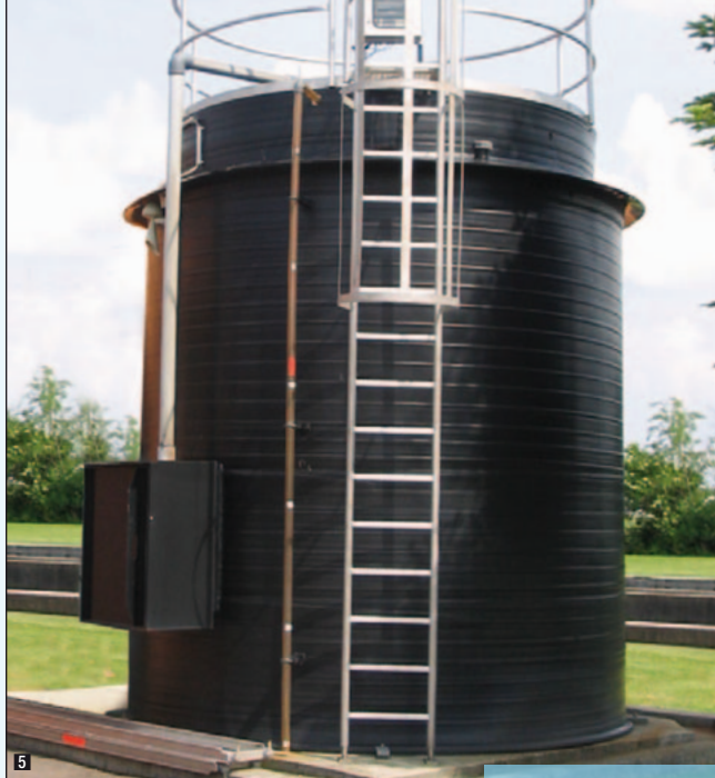
Serbatoio con vasca di sicurezza e scossalina anti-pioggia per stoccaggio coagulante per impianto trattamento acque (capacità 25.000 litri, Ø 3.000 mm, h 4700 mm)

I serbatoi Formoplast realizzati in estrusione rotativa secondo la Normativa Europea EN 12573, possono essere verticali od orizzontali. Hanno corpo cilindrico con diametro da 800 a 4000 mm, spessore da 10 a 150 mm, altezza da 1 metro a circa 24 metri, capacità da 1000 a 200.000 litri e soddisfano i requisiti sulle leggi di sicurezza e antinquinamento del territorio.