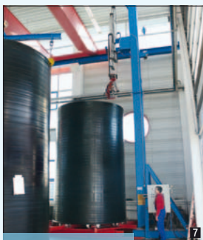
Fasi di lavorazione