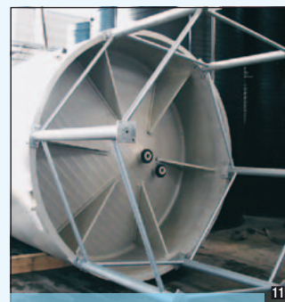
Serbatoio con fondo tronco conico

formoplast italia ® SERBATOI INDUSTRIALI IN ESTRUSIONE ROTATIVA