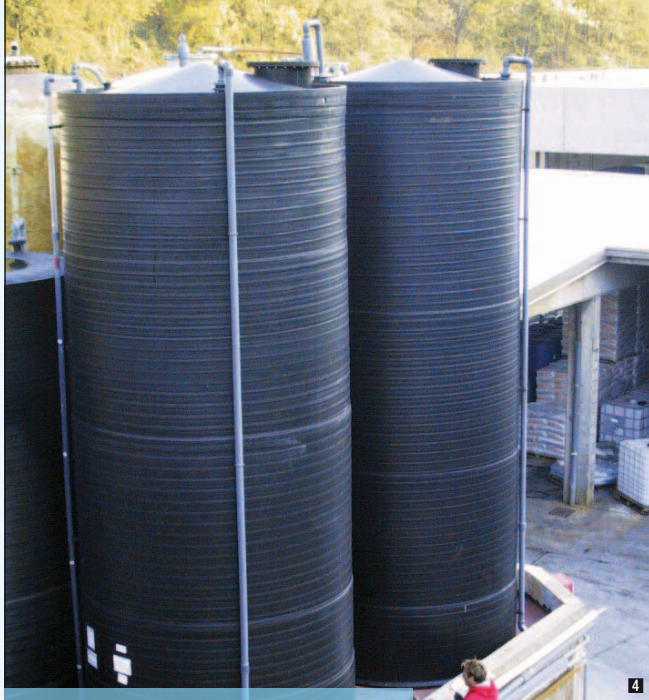
Serbatoi in bacino di cemento per stoccaggio acido fosforico 75% (capacità cad 50.000 litri, Ø 3.000 mm, h 7500 mm)